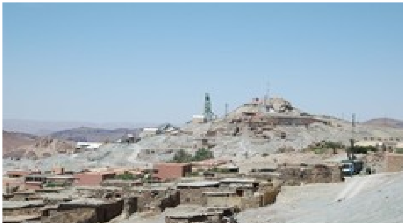
Ait-Semgane-n-el-grara es el último pueblo con carretera antes de Al Fougara

En el aeropuerto os esperamos con microbuses (furgonetas de 9 plazas) y nos trasladamos a por carretera